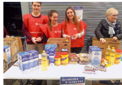
Recollida d'aliments per a Càritas

Càritas intensifica l'ajut a les famílies en acostar-se el Nadal. A Càritas Diocesana es disposa de 205 serveis de rober i rebost. Els robbers asseguren la provisió de roba gràcies a les nombroses donacions rebudes al llarg de l'any. En algunes poblacions disposem de botigues de roba. Aquests dies de Nadal s'incrementa la seva activitat.