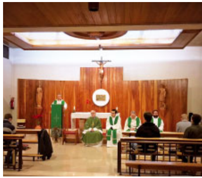
ri. Concelebrà la Missa i compartí la seva experiència amb l'equip de formadors i els seminaristes.

Diumenge 12, a les 11 h. Missa de la festa patronal a la parròquia de Sant Valentí de Terrassa.