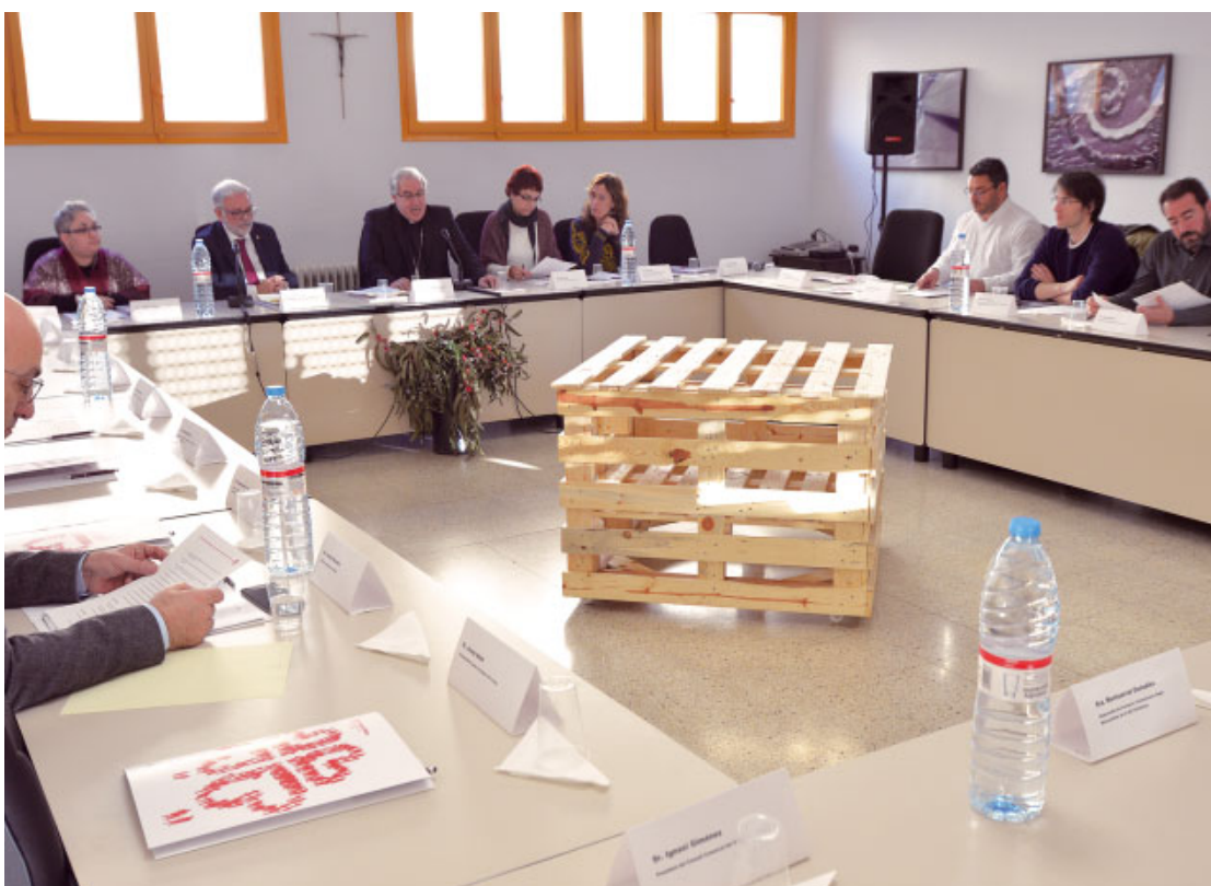
Constitució del Consell Assessor de l'Observatori de la Realitat Social (1/12/2016)

Amb la creació d'aquest Observatori no pretenem donar resposta a situacions puntuals, ni tan sols estructurals. És un fruit més de l'acció caritativa i social de la nostra comunitat diocesana, de les seves arrels més pregones, dels seus fonaments. En el meu parlament de l'acte de presentació vaig recordar els fonaments. El punt de partida és