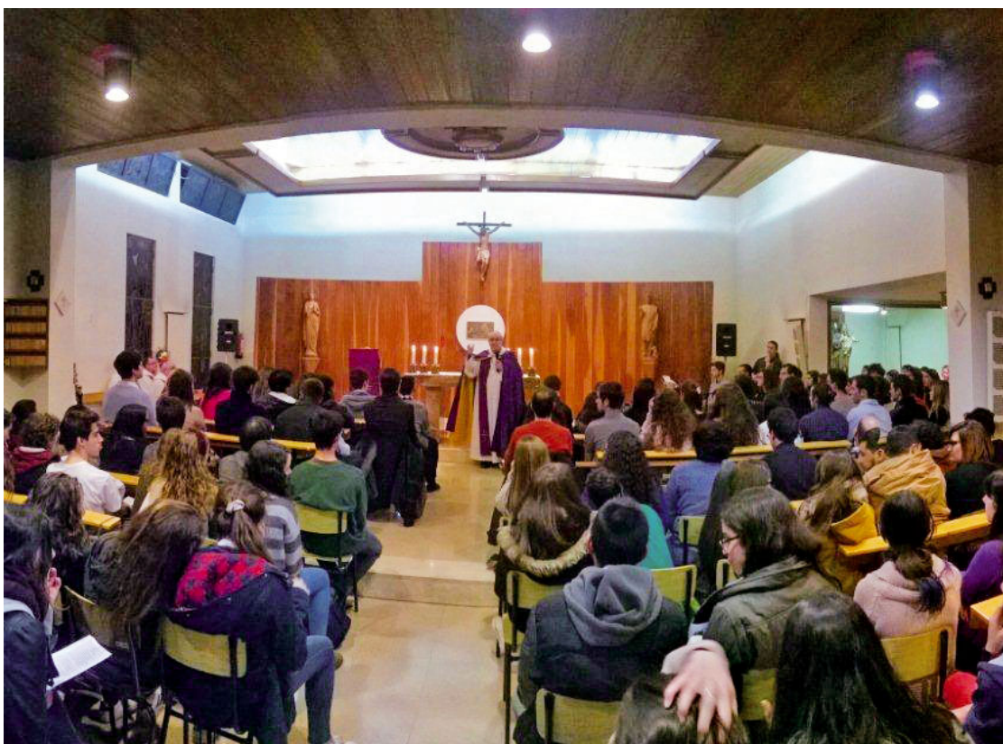
Vetlla de pregària per les vocacions a la capella del Seminari (2016)

El Beat Pau VI afirmava que tota vida és una vocació: «En els designis de Déu, cada home està cridat a desenvolupar-se, perquè tota vida és una vocació. Des del seu naixement ha estat donat a tots com una llavor, un conjunt d'aptituds i de qualitats per a fer