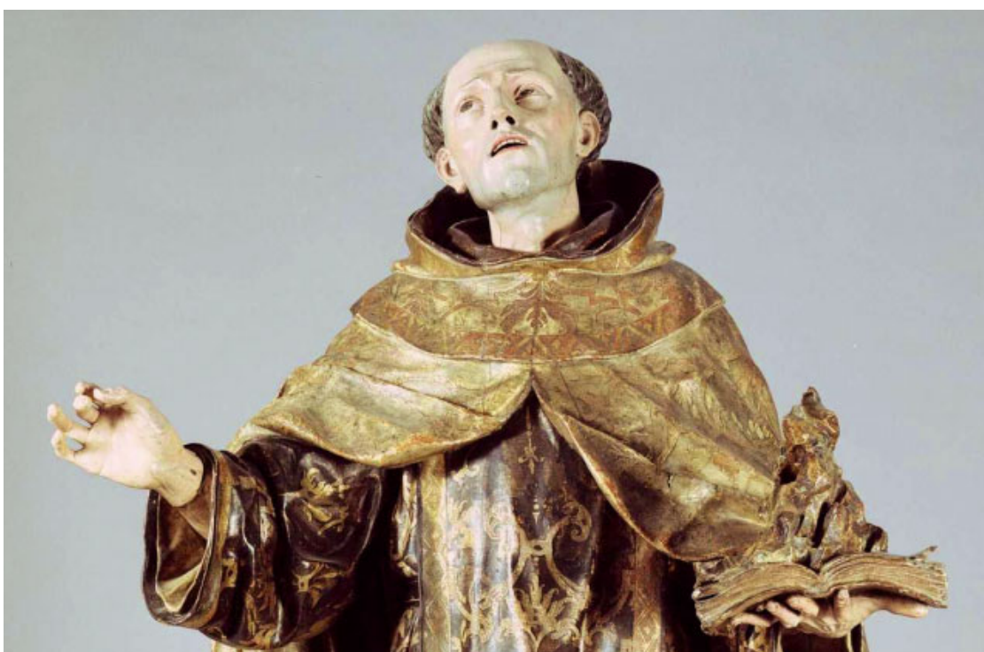
Sant Joan de la Creu (1675), de Francisco Antonio Gijón. National Gallery of Art, Washington (EUA)

El pelegrinatge es viu en grup, en família, en Església. El pelegrí renova i confirma la seva fe i descobreix que no està sol, que hi ha moltes altres persones que comparteixen els seus ideals, que hi ha una altra manera de viure i un altre sentit més elevat. L'Església és pelegrina i acompanya el pelegrí perquè viu en un temps d'espera, un temps que adquireix un sentit ple quan s'orienta a la vida futura. L'home, certament, pot aferrar-se als béns materials, al poder, al plaer, a les conquestes personals i als honors, però al capdavall es trobarà buit perquè està creat per a alguna cosa més, per a la transcendència. És aquesta inquietud la que mou a caminar fins a l'encontre amb Aquell que pot omplir els seus anhels de transcendència i de plenitud.