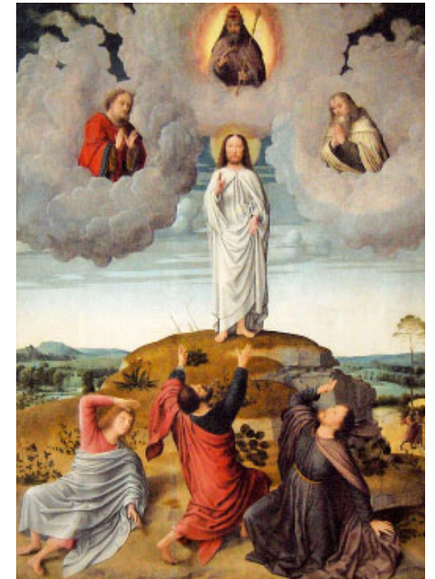
Transfiguració de Crist (1523) de Gerard David. Església de Nostra Senyora, Bruges (Bèlgica)

Amb Pere, Jaume i Joan acompanyem Jesús Tabor amunt i preguem. Ell es torna tot lluminós. L'acompanyen dos personatges: Elies i Moisès. Il·luminen el camí de Jesús, que Pere no comprenia. Moisès i Elies —la Bíblia— també ens mostren el nostre camí. Passa per on caminem nosaltres, per on caminà Jesús. No hi ha dreceres. No podem esquivar la creu. Però podem trobar la manera de dur-la amb elegància i ajudant els altres companys de camí. Com Jesús. Com Moisès i com Elies.