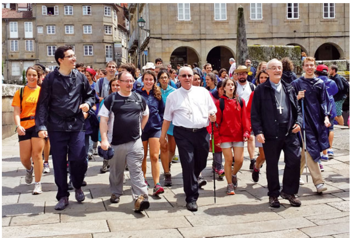
El Sr. Bisbe i el Sr. Bisbe auxiliar amb joves arribant a Santiago de Compostela (2014)

El lema de la Jornada d'aquest any és «La Vida Consagrada, encontre amb l'Amor de Déu». La finalitat primera i última de l'acció evangelitzadora de l'Església és propiciar en les