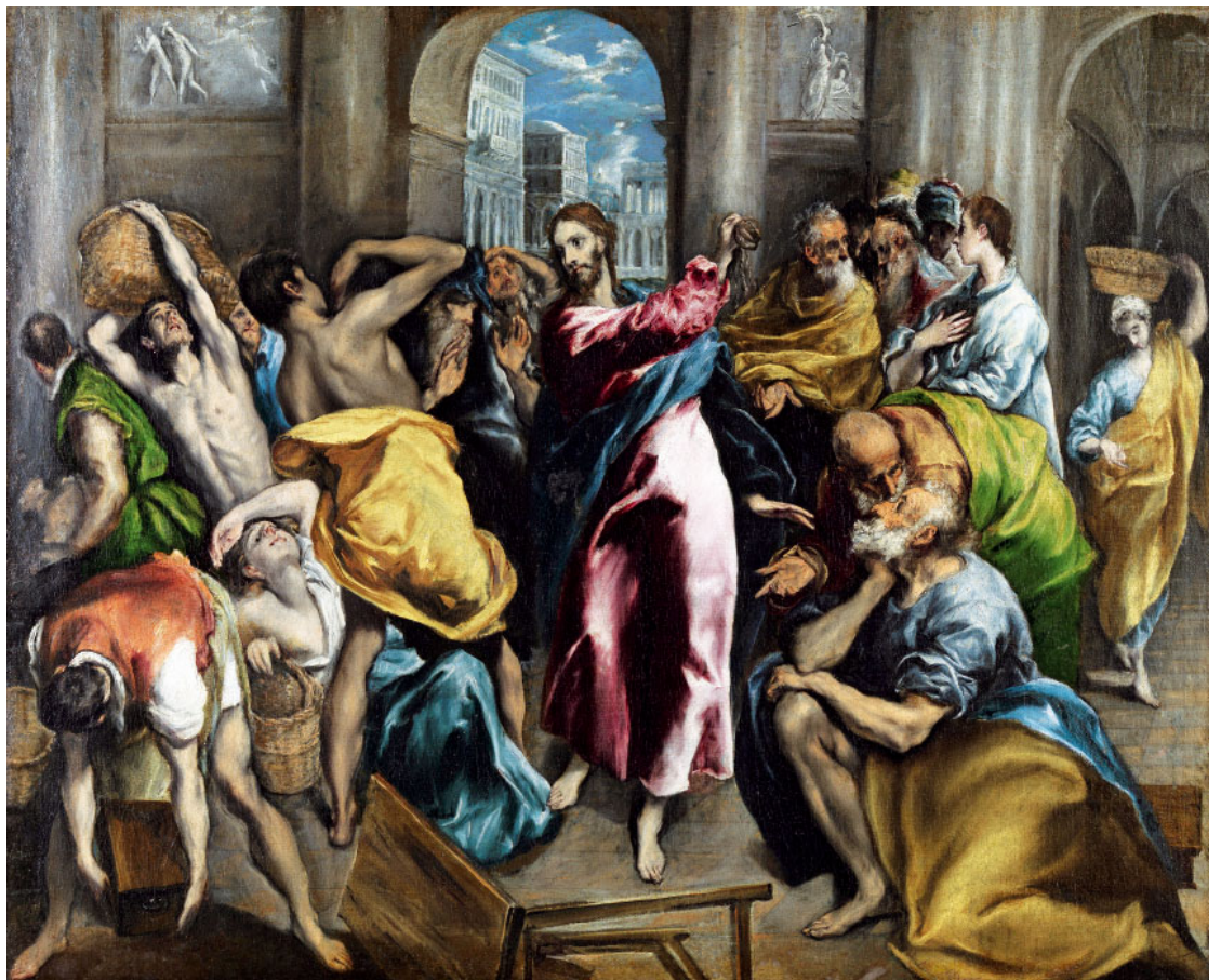
L'expulsió dels mercaders del Temple (1567-1570), El Greco

Els jueus reaccionen demanant comptes d'aquella conducta sorprenent, i Jesús respon d'una manera misteriosa fent referència a la seva mort i resurrecció: «Destruïu aquest santuari i jo el reconstruiré en tres dies». Ell parlava del temple del seu cos i es referia a la resurrecció al tercer dia de la seva