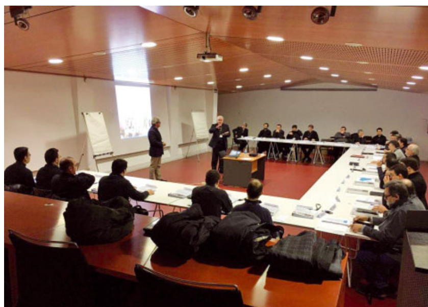
Curs de Lideratge pastoral, febrer-març 2017

El curs 2011-2012 vàrem iniciar la primera Visita Pastoral a la nostra diòcesi. En un sentit ampli, els bisbes fan contínuament visita pastoral, perquè al llarg de tot el curs visiten les parròquies i les comunitats de la diòcesi per diferents motius: confirmacions, festes majors, conferències, inauguracions, etc. Però es tractava de la Visita Pastoral canònica, en sentit estricte, a la que fan referència tant el Codi de Dret Canònic com el Directori per al ministeri pastoral dels bisbes, que recorda l'obligació que tenen de visitar la seva diòcesi cada any, del tot o en part, de manera que almenys cada cinc anys visiti la diòcesi sencera, personalment o per mitjà dels seus col·laboradors que puguin realitzar aquest servei.