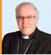
† Josep Àngel Saiz Meneses Bisbe de Terrassa